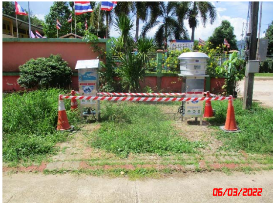
โรงพยาบาลส่งเสริมสุขภาพตำบลบ้านวัดบุญนา