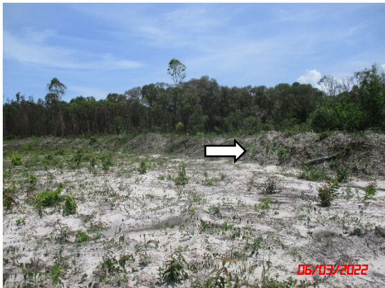
คันทำนบกดิน