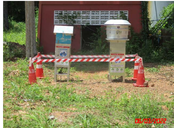
วัดสมอโพรง