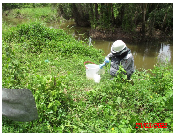
คลองลาวน (คลองสาธารณะประโยชน์ที่ดินที่โครงการ)