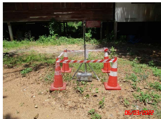
วัดสมอโพรง