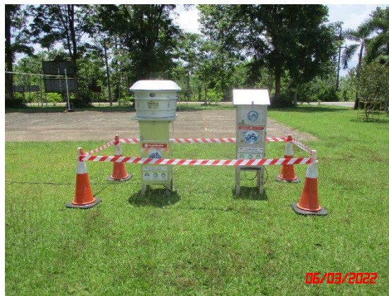
ที่ทำการองค์การบริหารส่วนตำบลชากโดน