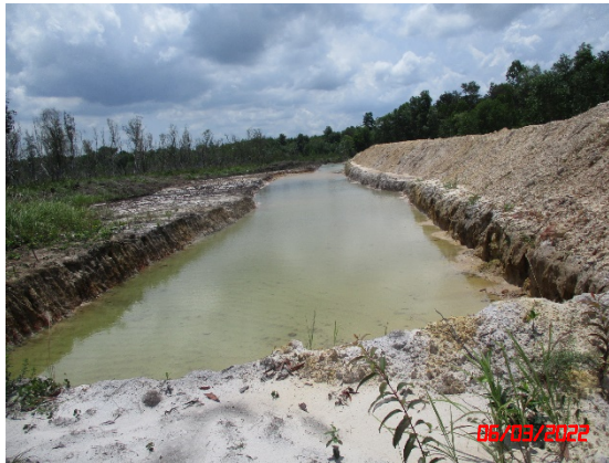
รูปที่ 2-7 เส้นทางขนส่งแร่