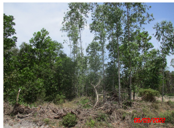
แนวต้นไม้รอบพื้นที่โครงการ