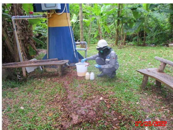
น้ำบาดโรงเรียนวัดสมอโพรง