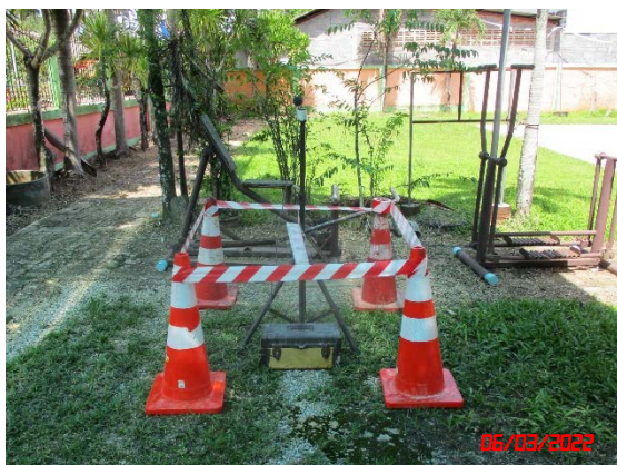
โรงพยาบาลส่งเสริมสุขภาพตำบลบ้านวัดบุญนา