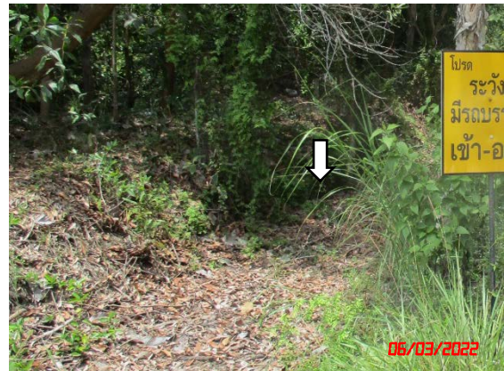
คูระบายน้ำ