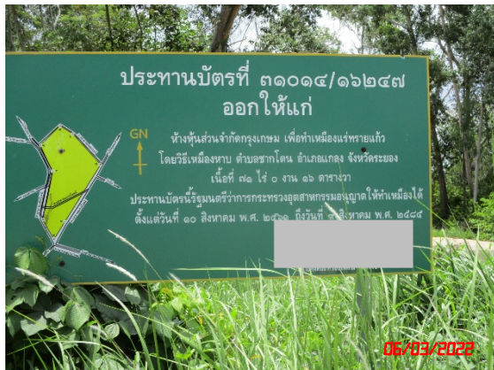
รูปที่ 2-1 ป้ายแสดงข้อมูลโครงการ