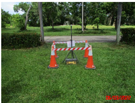
ที่ทำการองค์การบริหารส่วนตำบลชากโดน