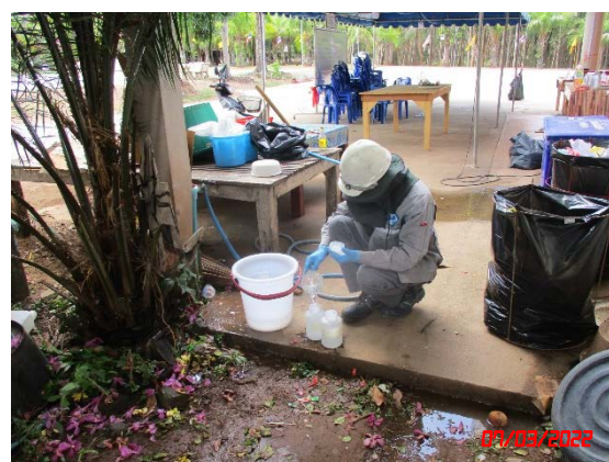
น้ำบาดาลบ้านสันติวัน